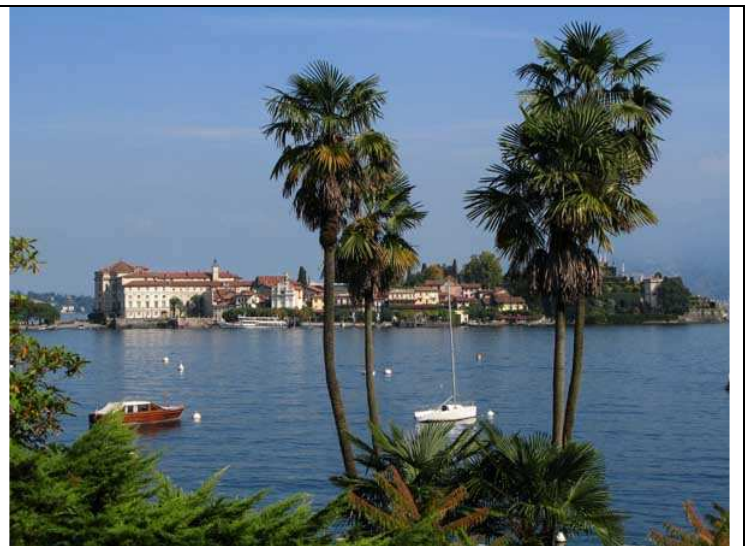
Le isole Borromeo

Cartografia: KOMPASS n°91 1:50.000 - Lago di Como, Lago di Lugano; Lago di Como 1:35.000 ZetaBeta.