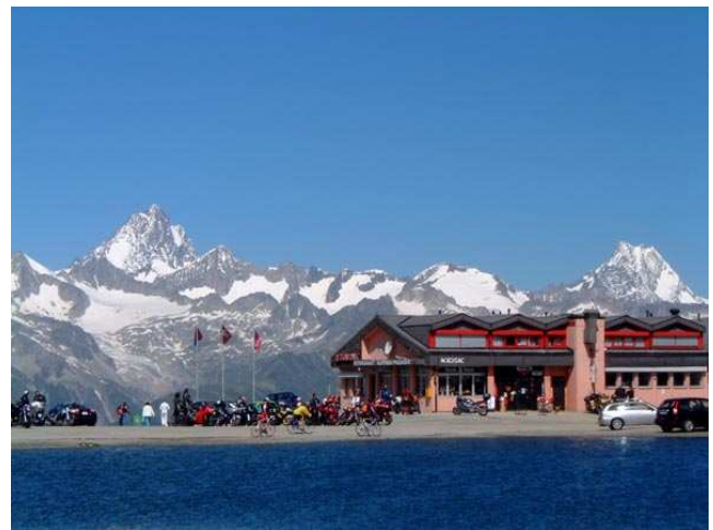
Il Passo del Nuefenen

Quota max: 2478m - Dislivello tot: 3000m Sviluppo: 105km Pendenza max: 8%