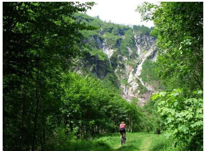
Le cascate al fondo della Valle di Vergeletto

Quota max: 1400m - Dislivello tot: 1750m Sviluppo: 75km