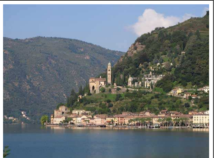
Vista su Morcote

Cartografia: KOMPASS n°91 1:50.000 - Lago di Como, Lago di Lugano; Lago di Como 1:35.000 ZetaBeta.