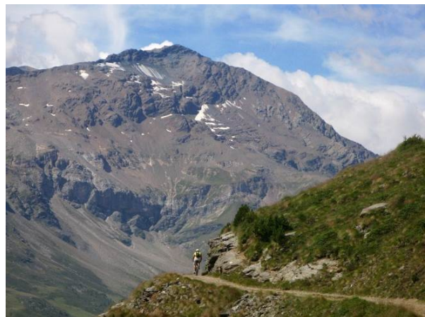
Il Monte Sobretta dalla stradina a quota 2300m

Quota max: 2560 m/2706 m - Dislivello tot: 1250 m/1750 m Sviluppo: 35 km/46 km