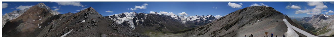
Panoramica a 360° dal Passo di Zebrù

Cartografia: KOMPASS n°636 1:25.000 - Ortles, Passo dello Stelvio, Valfurva. TABACCO n°08 1:25.000- Ortles Cevedale.