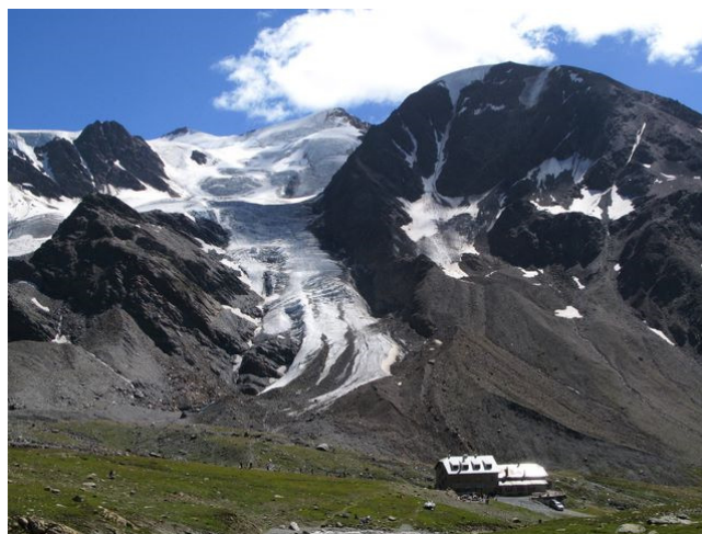
Il Rif.Pizzini e il Monte Cevedale

Quota max: 3010m - Dislivello tot: 1750m Sviluppo: 43km