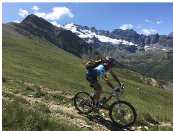
Discesa verso la Val Lia

Cartografia: KOMPASS n°96 1:50.000 - Bormio, Livigno, Corna di Campo.