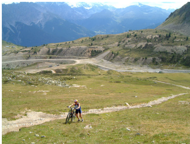
Verso la chiesetta di San Colombano

Quota max: 2463m - Dislivello tot: 1300m Sviluppo: 26km