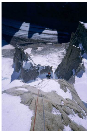
La rampa dopo i primi tiri verticali