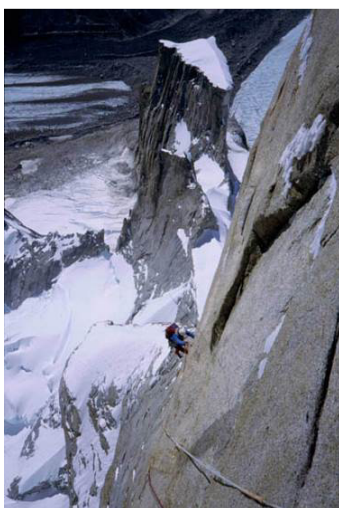
Sul traverso dei chiodi a pressione