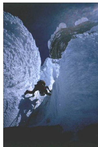
La zona delle Torrette sotto il muro finale