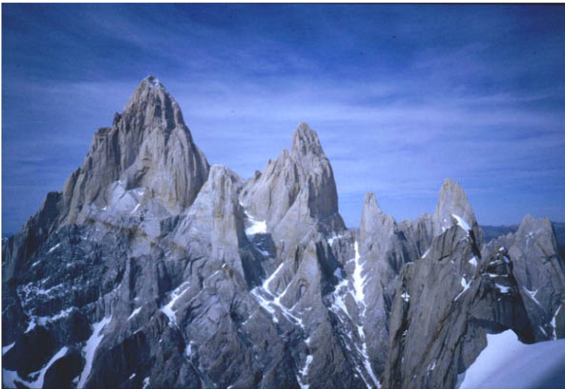
Il versante ovest del Fitz Roy (a sx.) e dell'Aiguille Poincenot (a dx.) visto dal Cerro Torre

Quattro giorni in stile alpino, 1000 m di zoccolo e canale dal 2 al 5+ e 50°, poi 700 m di pilastro di 6+/A2