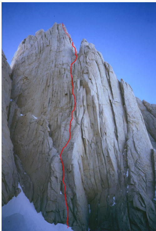
Il tracciato della via sul pilastro ovest

Disegni di Gino Buscaini su indicazioni di Paolo Vitali Su gentile concessione dell'autore, da PATAGONIA, di Gino Buscaini/Silvia Metzeltin - dall'Oglio editore